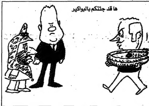
ها قد جتكم بالواكير

الطرفان الاسرائيلي والفلسطيني يتبادلان الاتهامات حول خرق الاتفاقات الطرفان الاسرائيلي والفلسطيني يتبادلان الاتهامات حول خرق الاتفاقات الطرفان الاسرائيلي والفلسطيني يتبادلان الاتهامات حول خرق الاتفاقات